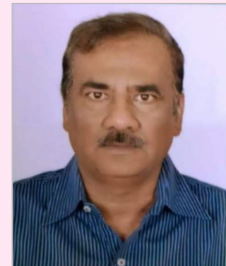
సృష్టి రహస్యములను దర్శించిన అద్భుత దార్శనికుడు!

జనులకు పవిత్రమైన భగవద్గీత, విష్ణు సహస్రనామములను అందించిన మహానీయుడు,