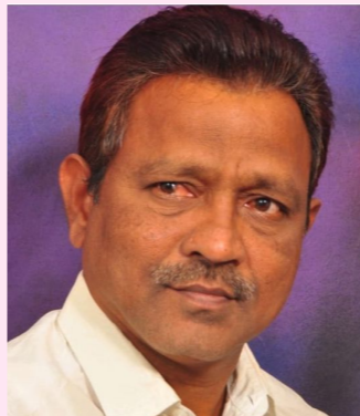
పండుగంటే నాట్యం - పాటంటే జీవం గిరిజన గుండెల్లో - ధర్మమే దీపం!

"మొక్కకు మమకారం - మట్టికి సత్కారం పక్షికి స్వేచ్ఛ - నదికి నివాళి నాదం