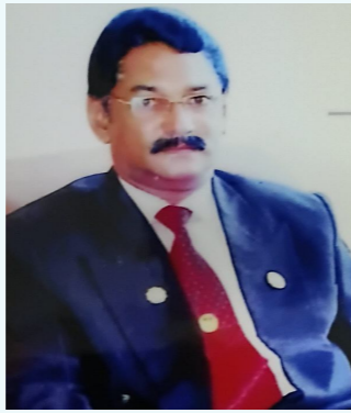
బడుగు రైతు గుండె ..

అత్తు 'హత్తు' చేసుకుంది.. పురుగుల మందు సాక్షి గా..!