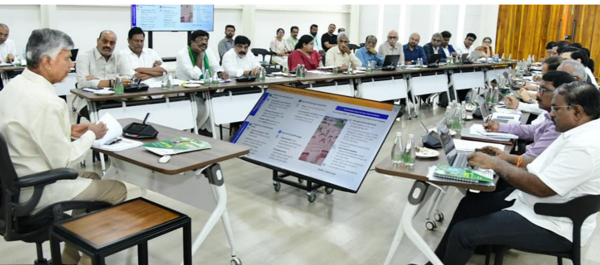
ప్రభుత్వం ఆమోదం తెలిపినట్లు వెల్లడించారు. రైతులు, మత్స్యకారులు, కట్టుబడి ఉందని సీఎం చంద్రబాబు స్పష్టం చేశారు. వ్యవసాయ అనుబంధ రంగాల అభివృద్ధికి ప్రభుత్వం పూర్తి స్థాయిలో

అమరావతి, మే 26 : రాష్ట్రంలో 'ఫార్మ్ టు హోమ్' విధానాన్ని అమలు చేయాలని సీఎం చంద్రబాబు పేర్కొన్నారు. రైతులు వండించిన వ్యవసాయ ఉత్పత్తులను నేరుగా వినియోగదారులకు చేరేలా కొత్త మార్కెటింగ్ వ్యూహాన్ని రూపొందిస్తున్నట్లు తెలిపారు. దీనివల్ల రైతులకు మెరుగైన ధరలు లభించడంతో పాటు మధ్యవర్తుల ప్రభావం తగ్గుతుందని చెప్పారు. వ్యవసాయ అనుబంధ రంగాలపై ముఖ్యమంత్రి నారా చంద్రబాబు నాయుడు సమీక్ష నిర్వహించారు. ఈ సందర్భంగా రాష్ట్రంలో వ్యవసాయం, ఆక్వా పశుసంవర్ధక రంగాలను మరింత బలోపేతం చేసే దిశగా పలు కీలక నిర్ణయాలు తీసుకున్నారు. పశ్చిమ గోదావరి జిల్లా దేవరపల్లి మండలం యడవోలు సమీపంలో 'కోకో నీట్' ఏర్పాటు చేయనున్నట్లు సీఎం వెల్లడించారు. అలాగే ఇండియన్ స్కూల్ ఆఫ్ అగ్రికల్చర్ కు జైర్ నెలలో శంకుస్థాపన చేయనున్నట్లు తెలిపారు. కడప జిల్లా పులివెందులలో నిర్మాణంలో ఉన్న ఫుడ్ టెక్నోలజీ ల్యాబ్ పూర్తి చేసేందుకు అవసరమైన నిధులను మంజూరు చేసినట్లు సీఎం పేర్కొన్నారు. వ్యవసాయ ఉత్పత్తుల నాణ్యత పరీక్షలకు ఈ ల్యాబ్ ఉపయోగపడుతుందని తెలిపారు. ఆక్వా రంగానికి ప్రోత్సాహంగా కొత్త ఆక్వా కనెక్షన్లకు విద్యుత్ సబ్సిడీ పద్ధింపజేయనున్నట్లు సీఎం చంద్రబాబు ప్రకటించారు. అలాగే మత్స్యకారుల సంక్షేమం కోసం 200 మెకనైజ్డ్ బోట్ల కొనుగోలుకు