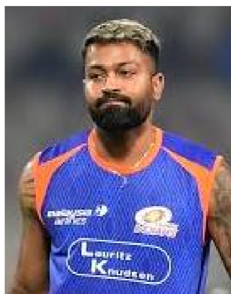
కావాలి. అప్పుడే మేనేజ్మెంట్ పరంగా సరైన నిర్ణయాలు తీసుకోగలం. అంతేకాని ఇప్పుడే హడావిడిగా హార్టిక్ భవిష్యత్తు గురించి మాట్లాడటం భాద్యతాహీనం అవుతుంది" అని కీరన్ పొల్కార్ పేర్కొన్నారు.

మహేంద్ర సింగ్ ధోనీతో లింక్ పెట్టడం ప్రారంభించారు. క్రికెట్ ప్రపంచంలో '7' అనే నంబర్ ధోనీ జెర్సీ నంబర్గా ఎంతటి గుర్తింపు తెచ్చుకుందో ప్రత్యేకంగా చెప్పక్కర్లేదు. సోషల్ మీడియా 7 నంబర్ అనగానే 'తలా ఫర్ ఏ రీజన్' ట్రెండ్ ఎంతలా వైరల్ అవుతుందో అందరికీ తెలిసిందే. ఇప్పుడు హార్టిక్ ఫోన్లో సరిగ్గా 7 గంటల 7 నిమిషాలు ఉన్నప్పుడు స్క్రీన్షాట్ తీసి పోస్ట్ చేయడంతో.. ఇదంతా ధోనీ కోసమేనని నెటిజన్లు కామెంట్ల వర్షం కురిపిస్తున్నారు. పైగా వచ్చే సీజన్లో హార్టిక్ పాండ్యా ముంబైని వీడి, ధోనీ మెంటార్గా ఉన్న సీఎస్కేలో సూపర్ కింగ్స్ జట్టులోకి మారబోతున్నాడనే హాట్ ఇన్ఫర్మేషన్ ఈ పోస్ట్ పెట్టడంలా కొందరు ఫ్యాన్స్ కామెంట్స్ చేస్తున్నారు. అయితే ఈ చర్చలపై హార్టిక్ కానీ, ముంబై యాజమాన్యం కానీ ఇప్పటివరకు ఎలాంటి అధికారిక స్పందన ఇవ్వలేదు. మరోవైపు ముంబై ఇండియన్స్ బ్యాటింగ్ కోచ్ కీరన్ పొల్కార్ ఈ సీజన్ వైఫల్యంపై స్పందిస్తూ.. హార్టిక్ పాండ్యా భవిష్యత్తుపై ఇప్పుడే ఎలాంటి నిర్ణయం తీసుకోలేదని స్పష్టం చేశాడు. "ప్రస్తుతం జట్టు ప్రదర్శనపై పోస్టుమార్ట్స్ చేయడానికి ఇది సరైన సమయం కాదు. ఇప్పుడు ఏ నిర్ణయం తీసుకున్నా అది భావోద్వేగాలతో కూడుకున్నది అవుతుంది. ఎక్కడ తప్పు జరిగిందో ప్రశాంతంగా కూర్చుని ఆలోచించడానికి ప్రతి ఒక్కరికీ కొంత సమయం, స్పేస్