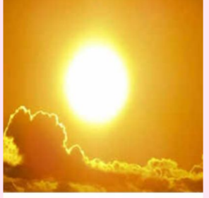
జీవులపై కరుణ లేదు.

ఏమిటి ఎండలు ఎక్కడి ఎండలు మందుతున్న సూర్యుడు మండిస్తున్న భాసుడు రాలుతున్న ప్రాణాలు ఆశలేని జీవులు.