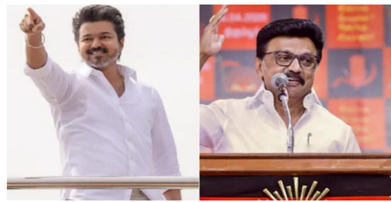
వ్యక్తం చేశారు. రాజీవ్ రోజుల్లో డీవీకే ప్రభుత్వం ప్రజాదరణను కాపాడుకోవడం అంత సులువు కాదని, డీఎంకే క్షేత్రస్థాయిలో మరింత బలంగా పుంజుకుంటుందని ఆయన కార్యకర్తల్లో జోష్ నింపారు.

వ్యాఖ్యలు ఇప్పుడు తమిళనాడు రాజకీయ వర్గాల్లో పెద్ద దుమారాన్ని రేపుతున్నాయి. సినిమా నుసామీ తాత్కాలికమే.. ప్రజలు మళ్లీ డీఎంకే వైపే! స్టాలిన్ తన ప్రసంగంలో విజయ్ ప్రభుత్వ భవిష్యత్తుపై తీవ్రమైన విమర్శలు గుప్పించారు. సినిమా గ్రామర్తో వచ్చే ఉత్సాహం ఎంతో కాలం నిలవదని, కొద్దిరోజులకే ప్రజల్లో ఆ ఆసక్తి తగ్గిపోతుందని ఆయన విశ్లేషించారు. పరిపాలనలో లోపాలు బయటపడినప్పుడు, అనుభవం ఉన్న నాయకత్వం విలువ ప్రజలకు తెలుస్తుందని పేర్కొన్నారు. "కొన్నాళ్ల తర్వాత తల్లి కోసం బిడ్డ వెతికినట్లుగా, సుపరిపాలన కోసం తమిళ ప్రజలు మళ్లీ డీఎంకే కోసమే వెతుకులాడతారు" అంటూ స్టాలిన్ ధీమా