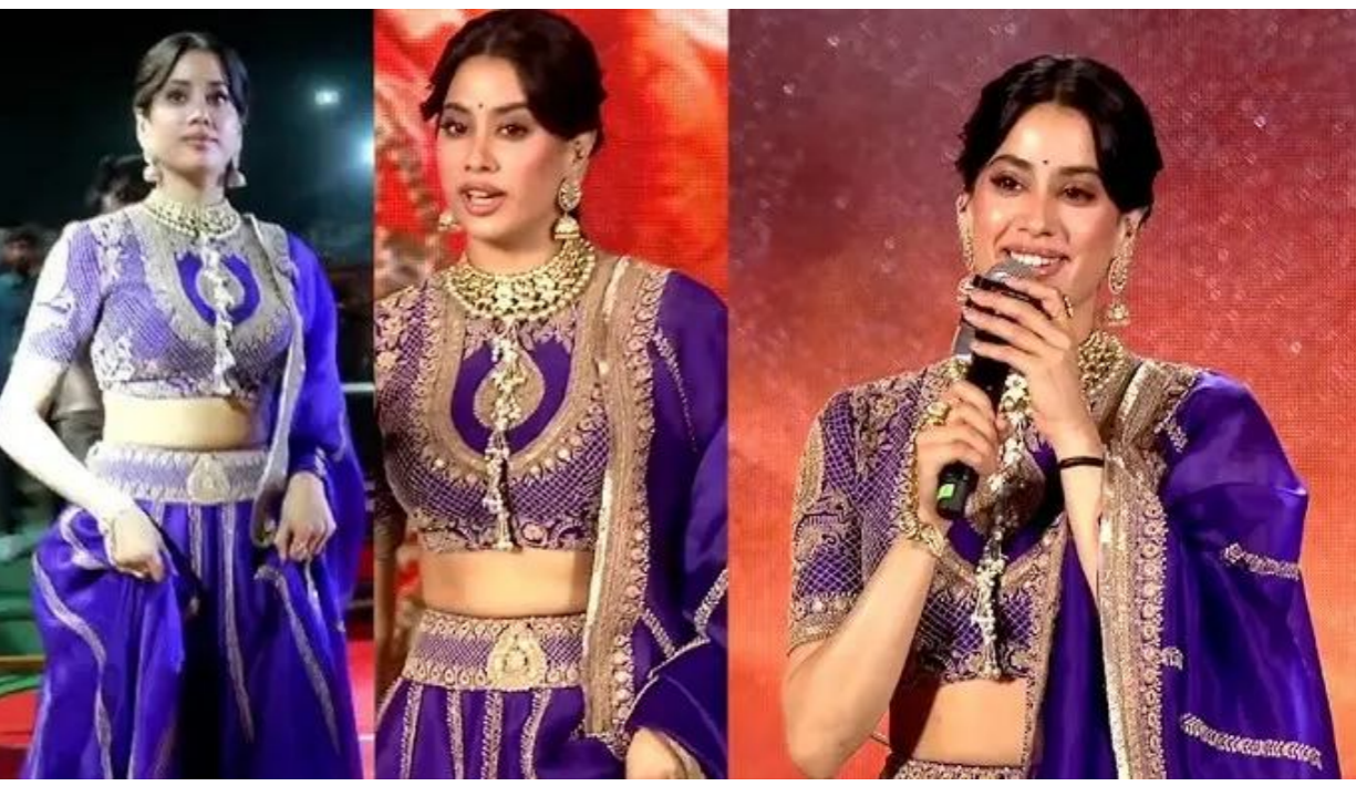
మరియు అమె అభినయం సినిమాపై మరియు వినోదం కలగలిసి చాలా గ్రాండ్గా అంచనాలను పెంచాయి. ఈ ఈవెంట్ ఫ్యాషన్ సాగింది.

పెద్ది సినిమా ప్రమోషన్లలో పర్పుల్ కలర్ లెహంగాలో జాన్వీ కపూర్ అందరి దృష్టిని ఆకర్షించారు. శనివారం భోపాల్ వేదికగా జరిగిన ఈ లైవ్ కాన్సర్ట్లో రామ్ చరణ్ తో కలిసి అమె పాల్గొన్నారు. ఈ సమయంలో అమె ధరించిన రాయల్ పర్పుల్ లెహంగా చాలా ప్రత్యేకంగా ఉంది. ఈ వేడుకలో జాన్వీ స్టైల్ మరియు అమె ట్రెండిషన్ లుక్ సోషల్ మీడియాలో బాగా వైరల్ అవుతోంది. జాన్వీ కపూర్ స్టైలిష్ ట్రెండిషన్ లుక్ జాన్వీ ధరించిన లెహంగాపై ఉన్న గోల్డ్ కలర్ జెబ్ వర్క్ అమెకు రాజనం ఉట్టిపడేలా చేసింది. మెడలో ముత్యాల హారం మరియు చెవులకు జువెల్స్ పెట్టుకుని అమె ఎంతో అందంగా కనిపించారు. చేతులకు ధరించిన డ్రైవెండ్ గాజులు అమె లుక్ ను మరింత పెంచాయి. నరళమైన మరియు ఆకర్షణీయమైన అలంకరణతో అమె అభిమానులను అలరించారు. : భోపాల్ ఈవెంట్లో సందడి రామ్ చరణ్ మరియు జాన్వీ కపూర్ కలిసి ఈవెంట్లో పాల్గొనడం అందరికీ కొత్త ఉత్సాహాన్ని ఇచ్చింది. దేశవ్యాప్తంగా పెద్ది సినిమా ప్రమోషన్లకు వస్తున్న స్పందన ఈ కాన్సర్ట్ ద్వారా సృష్టమైంది. జాన్వీ ఎంటిక చేసుకున్న దుస్తులు