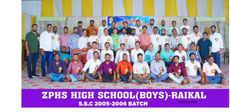
ZPHS HIGH SCHOOL(BOYS)-RAIKAL S.S.C 2005-2006 BATCH