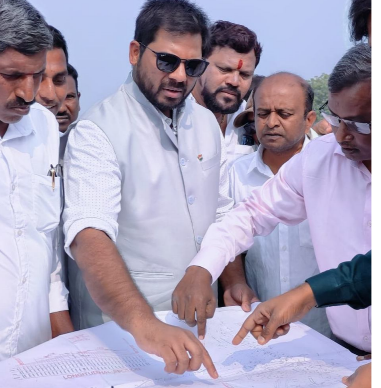
ఎంపీ గడ్డం వంశీకృష్ణ కృషితో పెద్దపల్లి జిల్లాలో రైల్వే లెవల్ క్రాసింగ్ల వద్ద ROBల ఏర్పాటు దిశగా ముందడుగు

భరోసానిచ్చారు. తమిళనాడులో సూర్యుడు (డీఎంకే గుర్తు) ఎప్పుడీ అస్తవించదు' అని స్టాలిన్ స్పష్టం చేశారు. ఓటమికి వ్యతిరేక బాధ్యత తీసుకుంటానని, సోషల్ మిడియాలో పార్టీపై వచ్చే విమర్శలను తిప్పికొట్టాలన్నారు. ఈ విషయంలో డీఎంకే చాలా ముందుదని పరోక్షంగా సూచించారు. ఒకప్పుడు మనం డీ రుకాతాలో మాట్లాడిన రాజకీయాలను ఇప్పుడు సోషల్ మిడియా వేదికలపై మాట్లాడాలని సూచించారు.