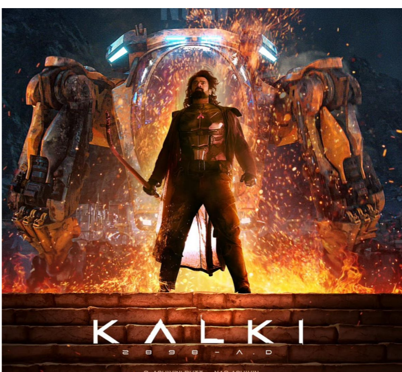
చిత్రీకరణ సమయంలోనే సీక్వెల్ కు పూర్తియినట్లు సమాచారం. ప్రస్తుతం సంబంధించిన సుమారు 30 శాతం మాటింగ్ హైదరాబాద్ లోనే పేసిన భారీ సెట్స్ లో అమితాబ్

పాన్ ఇండియా స్టార్ ప్రభాస్, వైవిధ్యభరిత దర్శకుడు నాగ్ అశ్వినీ కలయికలో వచ్చిన కల్కి 2898 ఎడి భారతీయ సినిమా స్థాయిని ప్రపంచవ్యాప్తంగా మరోస్థాయికి తీసుకెళ్లిన సంగతి తెలిసిందే. వెయ్యి కోట్లకు పైగా వసూలు సాధించిన ఈ విజవల్ వందర్ ఇప్పుడు రెండో భాగంతో మరింత భారీ స్థాయిలో ప్రేక్షకుల ముందుకు రానుండనే వార్తలు అభిమానుల్లో ఉత్సాహాన్ని పెంచుతున్నాయి. మొదటి భాగం ముగింపులో వచ్చిన ట్విస్టులు, ప్రభాస్ పాత్రకు సంబంధించిన ఎలివేషన్స్, కమల్ హాసన్ ఎంట్రీ ప్రేక్షకుల్లో భారీ ఉత్సాహం రేకెత్తించాయి. దీంతో ఇప్పుడు అందరి దృష్టి 'కల్కి 2'పైనే ఉంది. తాజా సమాచారం ప్రకారం ఈ చిత్రాన్ని 2027 డిసెంబర్ నాటికి విడుదల చేయాలని మేకర్స్ ప్లాన్ చేస్తున్నట్లు సినీ వర్గాల్లో టాక్ వినిపిస్తోంది. భారీ స్థాయిలో ఉండే విజవల్ ఎఫెక్ట్స్, సీజీబి వసూల కోసం ఎక్కువ సమయం అవసరమవుతుండటంతో నాణ్యత విషయంలో ఎలాంటి రాజీ పడకూడదనే ఉద్దేశ్యంతో భావిస్తున్నట్లు తెలుస్తోంది. హాబీవుడ్ స్థాయి విజవల్తో భారతీయ ప్రేక్షకులకు సరికొత్త అనుభూతి ఇవ్వాలనే లక్ష్యంతో దర్శకుడు నాగ్ అశ్వినీ ఈ ప్రాజెక్టును ఎంతో ప్రతిష్టాత్మకంగా రూపొందిస్తున్నారు. ఇప్పటికే మొదటి భాగం