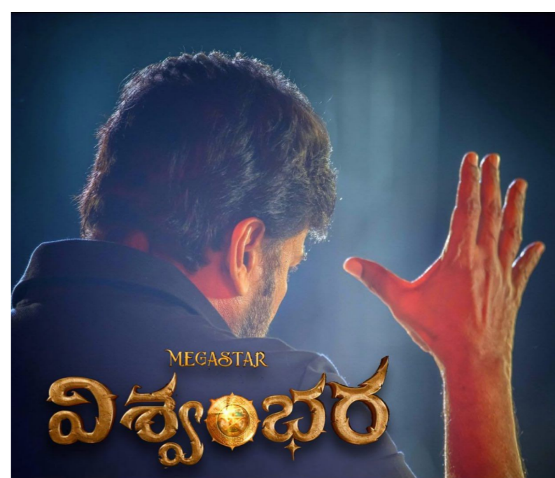
భారీ విజవల్ విడుదలగా నిలవబోతుందనే అభిప్రాయం సినీ వర్గాల్లో వ్యక్తమవుతోంది.