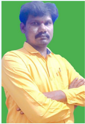
ఆ వేకువ రానుంది.... మన ధర్మం పోనుంది.

నవోదయం. కులం పేరుతో రక్తం చిమ్మి.. మతం మత్తుతో మనుషుల వీల్చి...ఎన్నాళ్ళి... విద్యేషాల వేట..? మానవత్వం మృగ్యమైన చోట..? మనిషిని మనిషిగా చూడని ఈ కుల మత వ్యవస్థ... సమాజాన్ని పట్టిపీడిస్తుంది. మానవ రక్తం ఎరుపేగా... కన్నీరు ఉప్పేగా... కష్టంలో కరిగేది మనిషేగా.. అగ్రవర్ణమే ఆకాశమై తన పాదంచే భూలోకాన్ని తొక్కిపెడుతున్న... తరాతరాల యాదర్శ సత్యం. కుల మతాల నిచ్చిన మెట్ల వ్యవస్థ... ఈ సమాజం నుండి కుట్టి కుమిచి నశించి.. నామరూపం లేకుండా అంతమవ్వాలి.