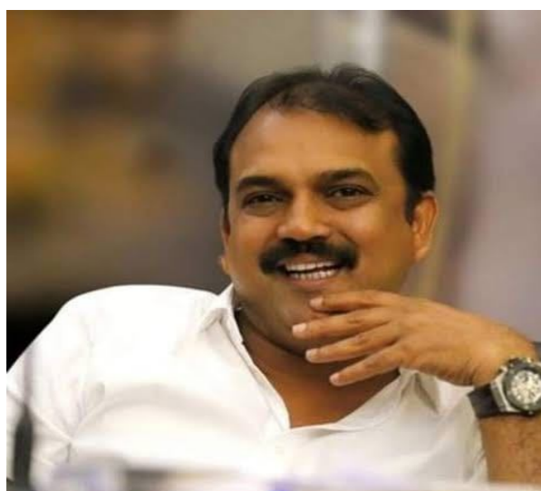
కొర్రపాల శివతో తదుపరి మూబీ అంటూ ప్రచారం