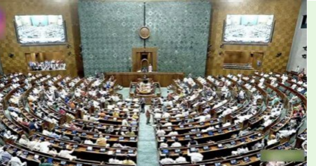
ఎన్నికలు జరుగుతున్నాయి. మహిళా రిజర్వేషన్లను 2029 నుంచి అమలు చేయడానికి వీలుగా 131వ రాజ్యాంగ సవరణ బిల్లు-2026ను కేంద్ర ప్రభుత్వం తీసుకొస్తోంది. ఇందులో 2026 జనాభా లెక్కలకు ముందే నియోజకవర్గాలను మగతా 2వ పేజీలో..

చేశాయి. ఇప్పుడు ఐదోది ఏర్పాటువుతోంది. ఇందులో రాష్ట్రాల నుంచి ఎన్నికయ్యే వారి సంఖ్యను 815గా, కేంద్ర పాలిత ప్రాంతాల నుంచి 35గా పేర్కొంది. ఇందుకోసం రాజ్యాంగంలోని ఆర్టికల్ 81ని సవరించాలని నిర్ణయించింది. దీని ప్రకారం దేశంలో లోక్ సభ స్థానాలు 54.54శాతం మేర పెరిగే అవకాశముంది. ఇప్పటి వరకూ ఆర్టికల్ 81(1) కింద రాష్ట్రాల నుంచి ఎన్నికయ్యే గరిష్ట లోక్ సభ సభ్యుల సంఖ్య 530, కేంద్ర పాలిత ప్రాంతాల నుంచి ఎన్నికయ్యే వారి గరిష్ట సంఖ్య 20గా ఉన్నాయి. అయితే ప్రస్తుతం 543 లోక్ సభ స్థానాలకే