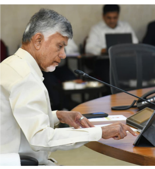
పోయి క్లిష్టంగా మారుతున్నాయంటూ అధికారుల తీరను ముఖ్యమంత్రి తప్పుబట్టారు. కార్యదర్శులు గతంలో స్పష్టమైన భాగస్వామ్యంతో చర్చల్లో ఏ సందేహం వచ్చినా పూర్తిగా