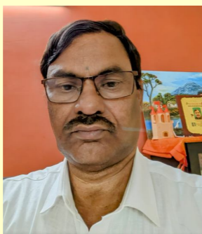
ప్రేమ అనే ప్రాణవాయువుతో స్నేహానికి జీవం పొద్దాం

ఎల్లలు ఎరుగు స్నేహంతో దేశాల మధ్య శాంతి సంహారత సామ్రాజ్యత్వ పరివ్యాప్తితో మైత్రి పరిమళాన్ని దశ దశలా వ్యాపింప చేద్దాం