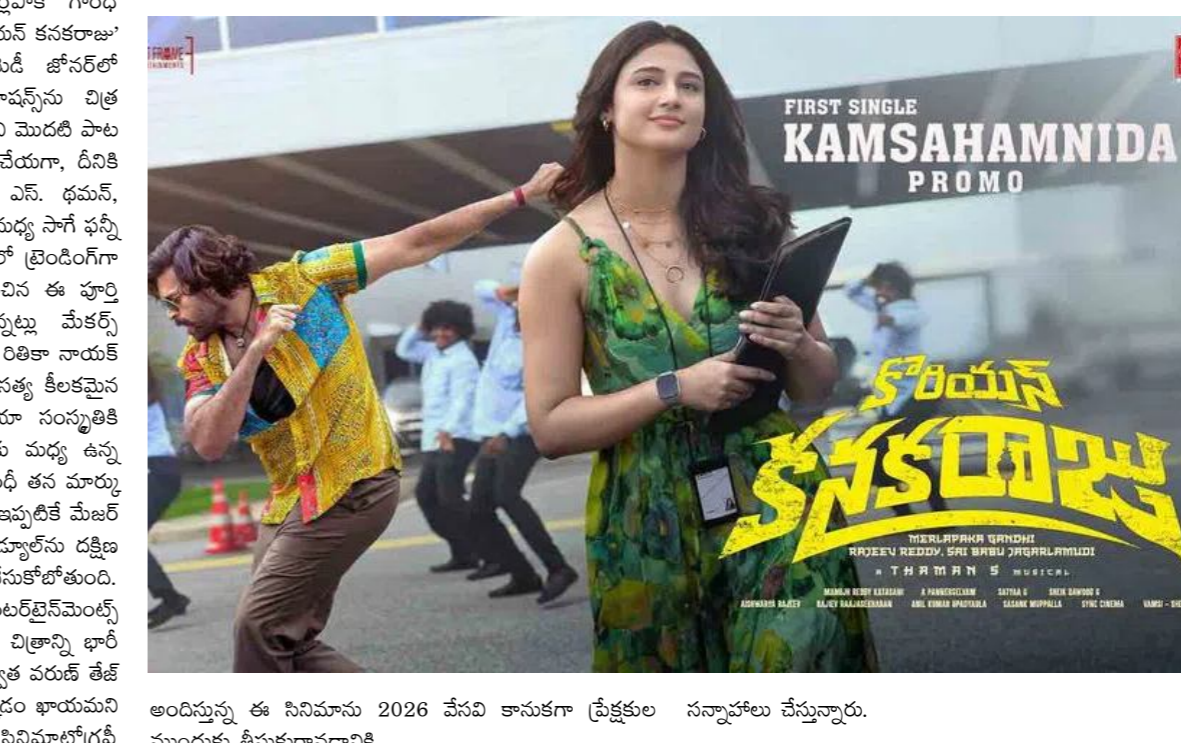
అందిస్తున్న ఈ సినిమాను 2026 వేసవి కానుకగా ప్రేక్షకుల సన్నాహాలు చేస్తున్నారు. ముందుకు తీసుకురావడానికి